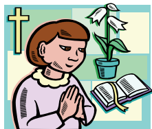
Rejoice in the Lord!

La Oración: Escrita por la jovencita es el compromiso que ella le va a hacer al Señor.